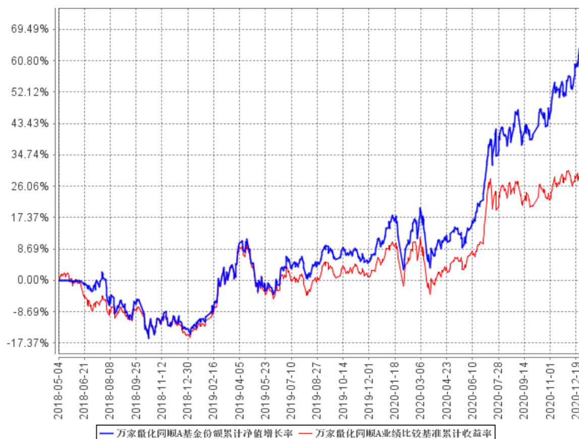
万家量化同顺A基金份额累计净值增长率与同期业绩比较基准收益率的历史走势对比图